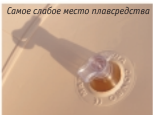
Самое слабое место плавсредства

Спортсмены-«баблабашки» рассказали нам некоторые технические нюансы своего необычного инвентаря. Плавучесть резиновой фемины составляет от 30 до 100 литров, в зависимости от модели. Правда, конструкцией не предусмотрены так называемые охваты (крепёж под колено на катамаране), но зато есть другие природно-физиологические выпуклости (и впуклости). К тому же, резиновая женщина, податливая в бытовом использовании, в экстремальных условиях ведет себя как её нажравшийся до чертиков «живой» прототип. Та ещё картина. Как удержаться на плаву, когда этот «бубль гум» ускользает из-под пальцев? Как не упустить упругие формы и первым прийти к финишу?